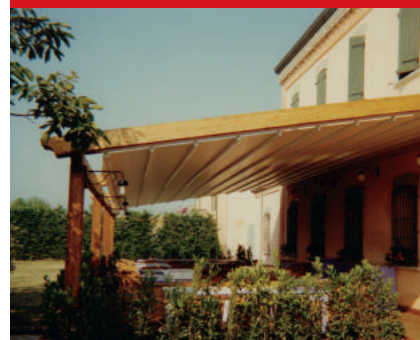
Pergolato con copertura retrattile