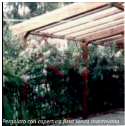
Pergolato con copertura fissa senza mantovana