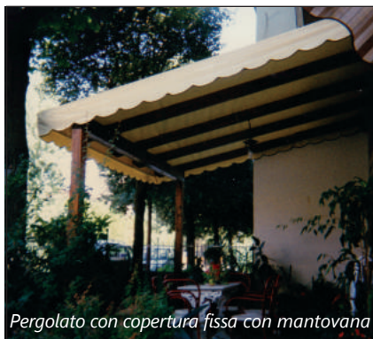
Pergolato con copertura fissa con mantovana

Per soddisfare le varie esigenze dei clienti, offriamo pagamenti dilazionati con interessi a tasso zero o pagamenti personalizzati.